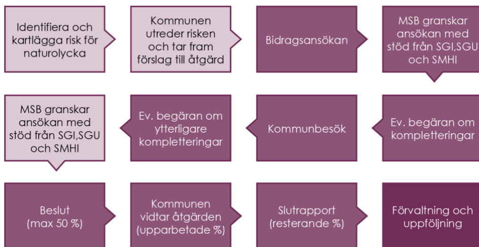
Figur 3. Ansökningsprocessen.