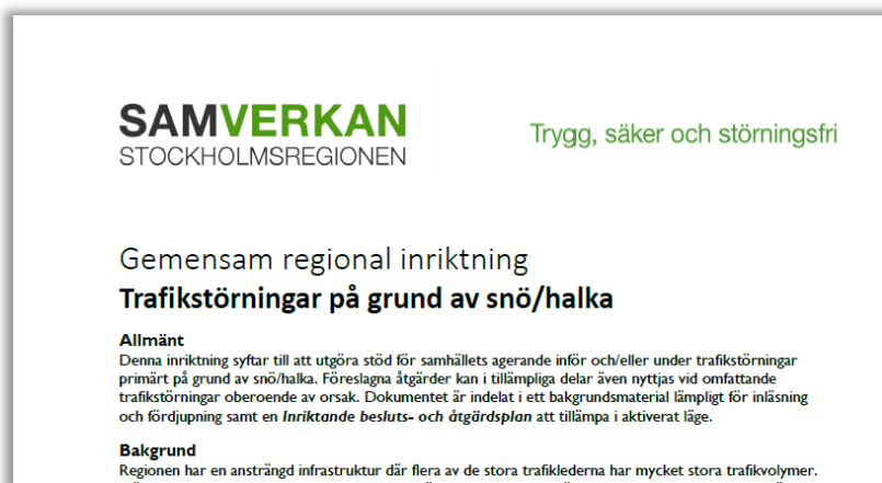
Bild 1: Gemensamt framtagen regional inriktning för trafikstörningar p.g.a. snö/halka, Samverkan Stockholmsregionen

Ett exempel på en överenskommen inriktning är Trafikstörningar på grund av snö/halka . I inriktningen har ställts upp fakta, antaganden och en inriktning bestående av målbild och prioriterade åtgärder både i ett förberedande och hanterande skede.