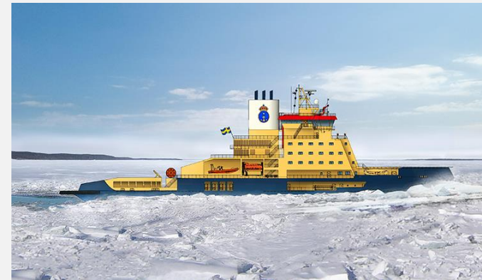
Illustration av Sjöfartsverkets nya isbrytare

Design på nästa generations isbrytare som kan bryta bredare isränna och manövreras enklare.