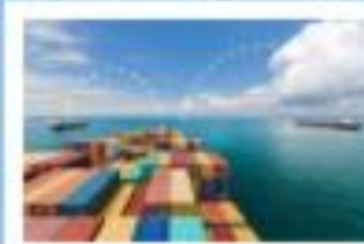
Forskning & innovation