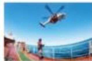
Sjö- och flygräddning