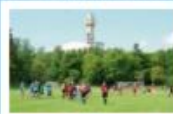
Kultur och fritidsaktiviteter för sjöfolk