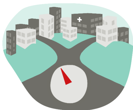
Figur 1. Förhållningssätt som en mental kompass vid hantering av samhällsstörningar.

Förhållningssätten kan beskrivas som sätt att tänka som påverkar våra resonemang, attityder och agerande . De kan ses som mentala kompasser som vägleder vårt tänkande och våra handlingar på ett konstruktivt sätt. Syftet med förhållningssätten är att de ska motverka vanliga brister vid hanteringen av samhällsstörningar i fredstid och under höjd beredskap.