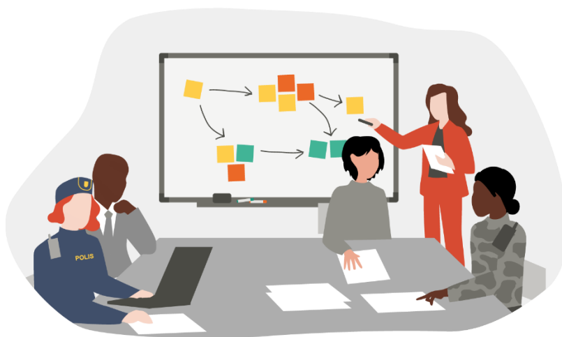
Figur 8. Med andra personers bidrag i beslutsprocessen får vi ofta ett bättre beslutsunderlag.

Vid hantering av samhällsstörningar som kräver samverkan kan detta vara särskilt viktigt, eftersom det kan vara svårt att få acceptans för ett beslut baserat på intuition utan att vi kan förklara hur vi har kommit fram till det. Det är därför bra att sträva efter så stor transparens som möjligt i beslutsprocesserna. Då kan andra förstå hur vi har förstått problemet och upptäcka vad som eventuellt saknas i analysen. Det är även viktigt att det finns en dokumenterad spårbarhet i de beslut som fattats, inte minst när man ska utvärdera hanteringen av händelsen.