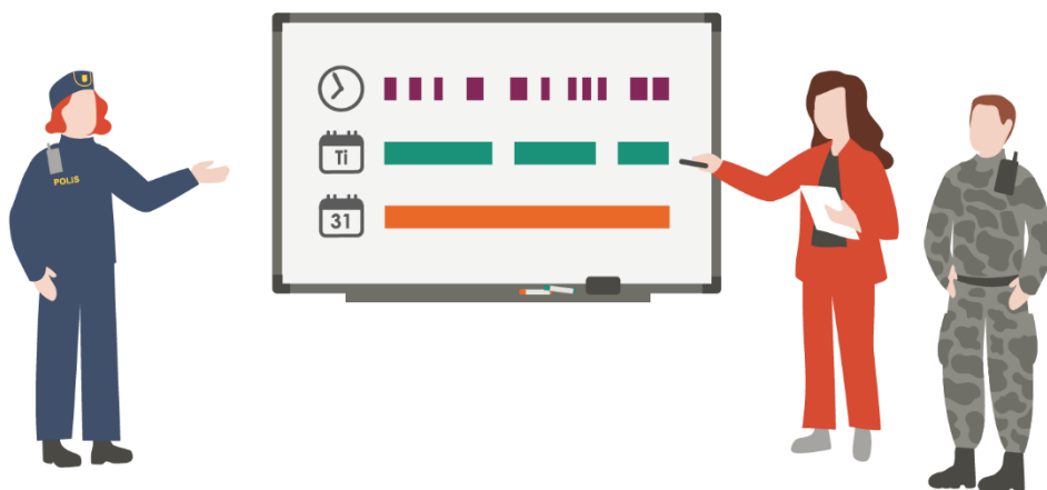
Figur 6. Hanteringen sker i olika tidsskalor. Det krävs en organisation som kan hantera de omedelbara åtgärderna, samtidigt som den också kan planera för det som kommer längre fram.

I det aktörsgemensamma arbetet är det därför viktigt att vara tydlig i sin kommunikation kring vad som avses när man använder olika tidsbegrepp. Det är också viktigt att identifiera olika aktörers roller och säkerställa att såväl omedelbara behov som behov på lång sikt omhändertas i den aktörsgemensamma hanteringen av samhällsstörningen.