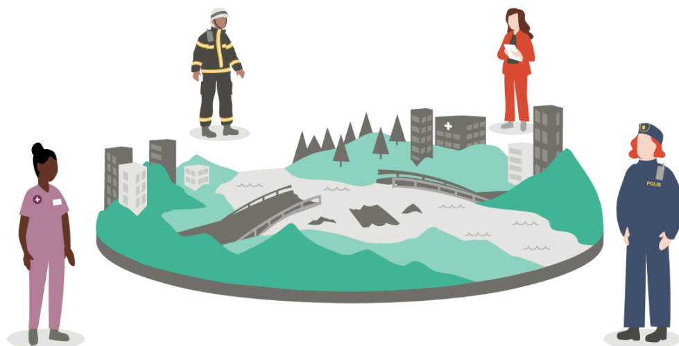
Figur 5. Vi utgår från våra egna uppdrag och kommer tolka samhällsstörningen utifrån vårt eget perspektiv. Om vi aktivt försöker förstå andras perspektiv får vi en mer heltäckande bild av samhällsstörningen och hjälpbehoven.

Det är även viktigt att reflektera kring eventuella maktförhållanden mellan olika aktörer. Faktorer som kan påverka detta är storlek på organisation, resurser och tidigare erfarenheter från andra samhällsstörningar. Genom att bli medveten om olika styrkeförhållanden, informella ledarskap och normer kan vi också hantera eventuella obalanser genom att aktivt lyfta fram aktörer och perspektiv som annars riskerar att inte komma till tals eller osynliggöras.