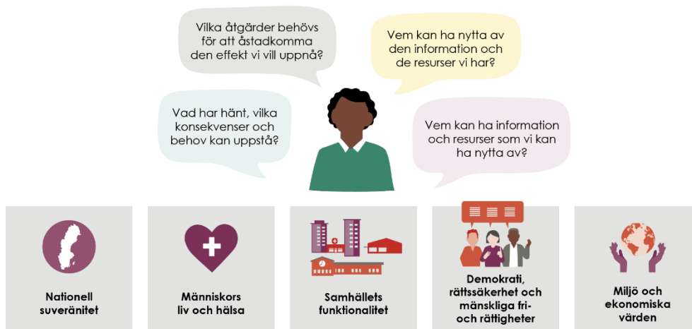
Figur 3. Med samhällets skyddsvärden som utgångspunkt ger helhetssyn en samlad bild av de totala behoven, resurserna och effekterna.