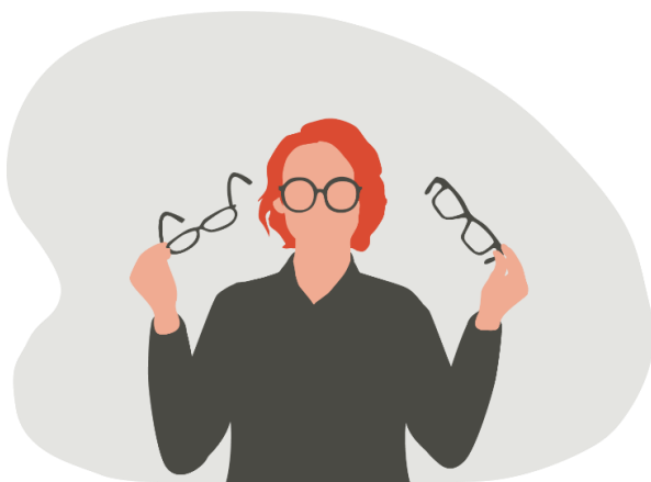
Figur 4. Tillsammans betraktar vi situationen med ”olika glasögon” och förstår skeendet på olika sätt.

Förståelse för andra aktörers perspektiv gör det möjligt att betrakta händelseutvecklingen med ”olika glasögon” och förstå situationen på olika sätt. Vi får en mer heltäckande bild av konsekvenser och hjälpbehov, samt bättre underlag för att kunna identifiera relevanta åtgärder. Det ger oss även insikt i vad andra aktörer behöver och kan bidra med under hanteringen av samhällsstörningar. Perspektivförståelse är en del i att åstadkomma helhetssyn.