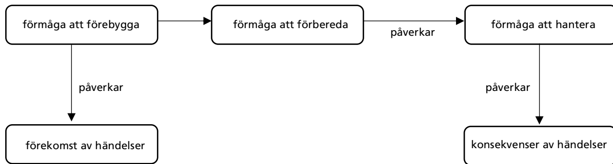
Figur 4. Förmågan att förebygga respektive förmågan att förbereda och hantera har olika mål.

det förberedande och hanterande arbetet är målet till syvende och sist att minska konsekvenserna av händelser; förmågan att förbereda och hantera händelser påverkar konsekvenserna.